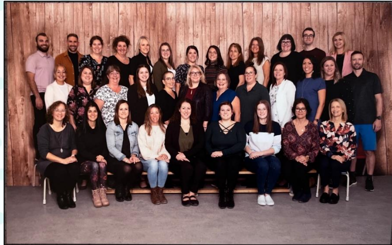
Les membres du personnel